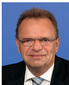
Landrat Winfried Becker